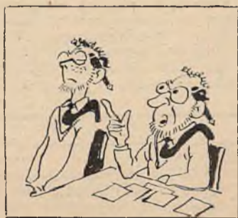
— І гэта ўсё, чаму я цябе навучыў за семестр?..

— Кто там стучится в поздний час? «Конечно, я, Финдлей!» — С тобой встречаюсь в пятый раз! «В седьмой», — сказал Финдлей. — Но ты не сдашь ведь все равно? «Не сдам», — сказал Финдлей. — Раз в голове твоей темно... «Темно», — сказал Финдлей. — Небось девчонки на уме? «Угу», — сказал Финдлей. — Тебя же выгонят к весне. «Должны», — сказал Финдлей. — Пасти свиней пойдешь опять? «Пойду», — сказал Финдлей. — Весь день на дудочке играть? «Весь день», — вздохнул Финдлей. — А ты, приятель, не дурак? — «Ну нет», — вскипел Финдлей. — Зайдешь ещё раз, или как? «Зайду», — вскричал Финдлей.