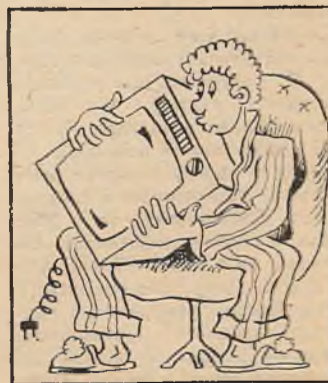
— Бывай, родны. Сустрэнемся пасля сесіі...